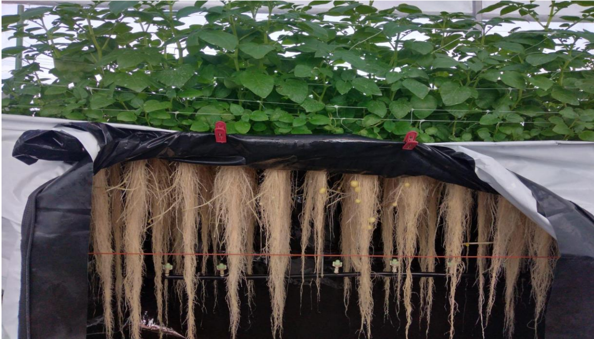
Figura 8. Inicio de la tuberización teniendo una C.E de 1.2 ds-m (Elaboración propia).