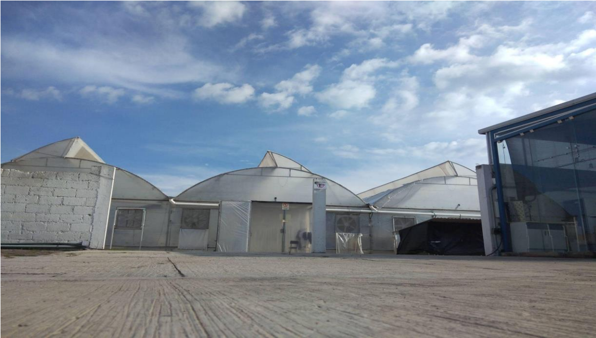
Figura 2. Instalaciones de la Empresa (Elaboración propia).