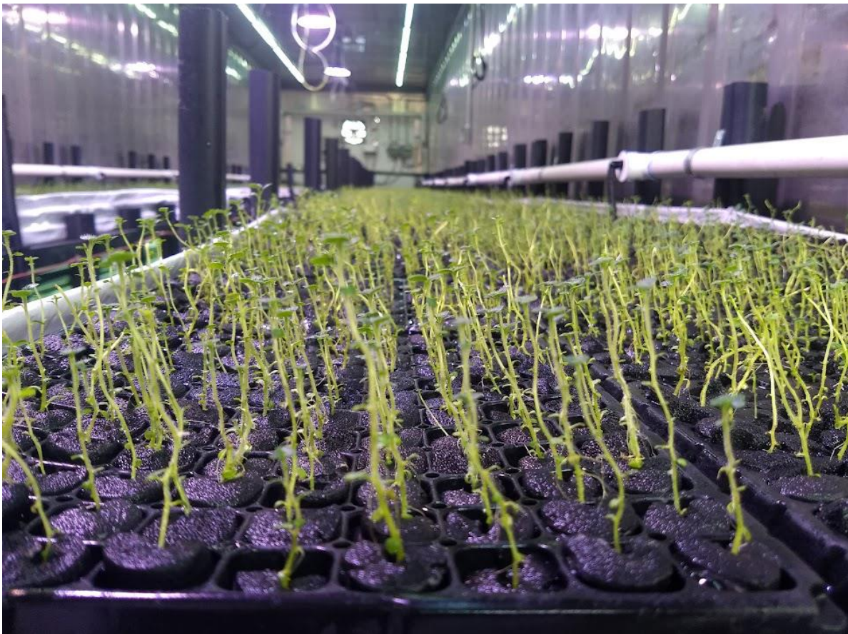
Figura 4. Proceso de adaptación de las plántulas. (Elaboración propia).

Las plántulas pasaron por un proceso de adaptación antes de ser trasplantadas a los módulos aeropónicos, como se muestra en la figura 4 el cual tuvo una duración de 10 días en un cuarto de burbujeo, la figura 5 muestra el sistema de burbujeo, posteriormente en la figura 6 se puede observa el trasplante a módulo el día 21 de mayo de 2021.