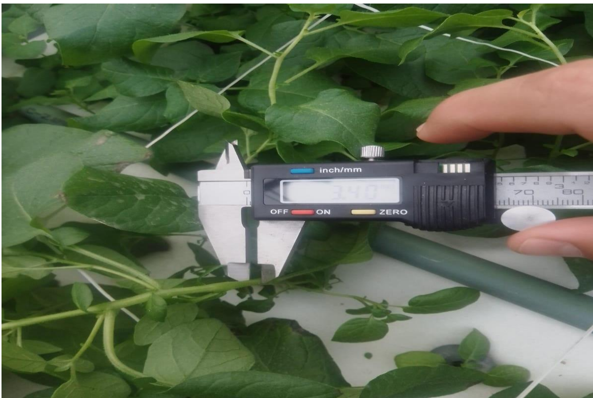
Figura 12. Medición de diámetro del tallo. (Elaboración propia)