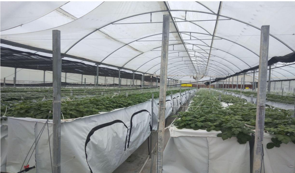
Figura 3. Producción de minitubérculos de papa en un sistema aerónico. (Elaboración propia).