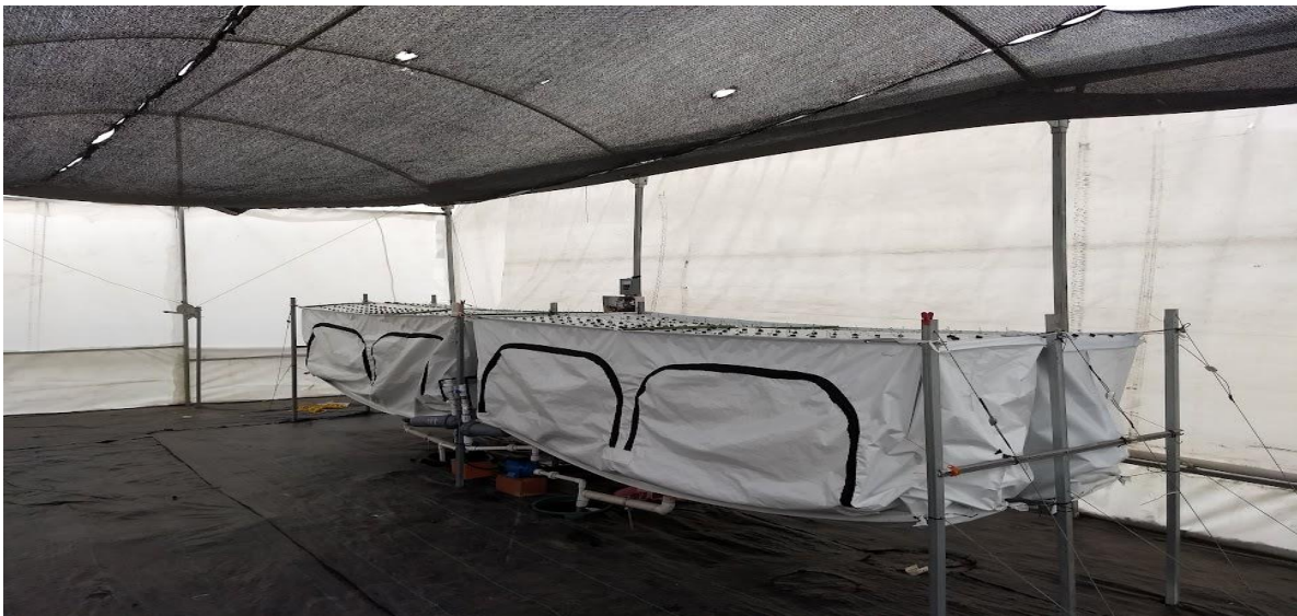
Figura 15. Instalaciones del invernadero donde se estableció el experimento de producción de semilla de papa en un sistema aeropónico.

En la figura 15 se muestra el experimento que fue realizado al interior de un invernadero de 9.0 m de longitud por 6.0 m de ancho, altura de 3.60 m, con una malla sombra de 70%, con 30% luz. Este invernadero no tiene control automático de la temperatura. Para el establecimiento del experimento se contó con cuatro módulos aeropónicos de 3.0 m de longitud y 1.5 m de anchura cada uno. El riego está controlado de manera computarizada, y en cada módulo se aplicó cada una de las soluciones nutritivas referidas.