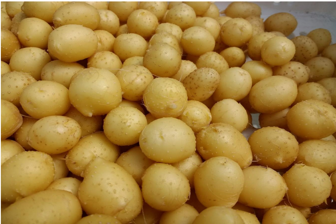
Fig. 14. Mini tubérculos Calibre 15.