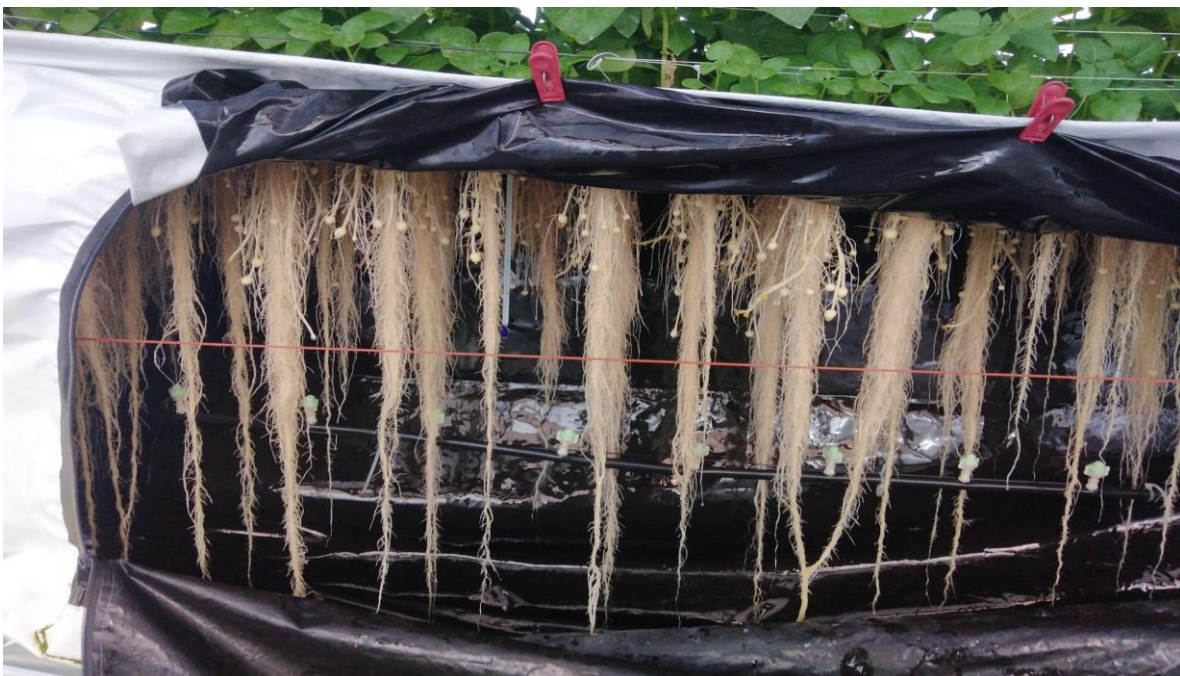
Figura 9. Llenado de minitubérculo en esta etapa la C.E es de 1.5 a 1.8 ds-m (Elaboración propia).