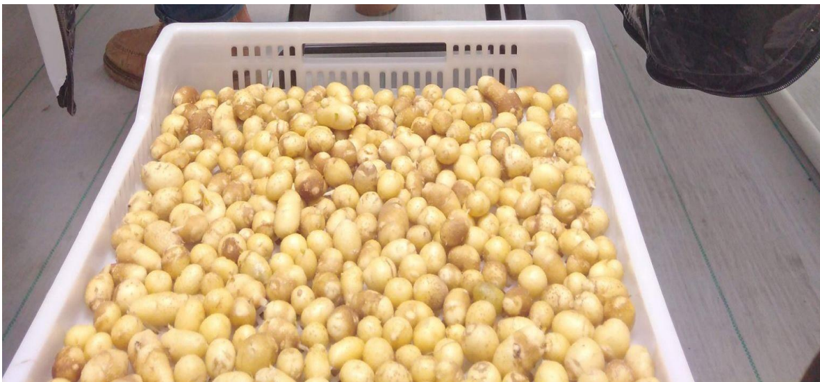
Figura 10. Cosecha de minituberculos.