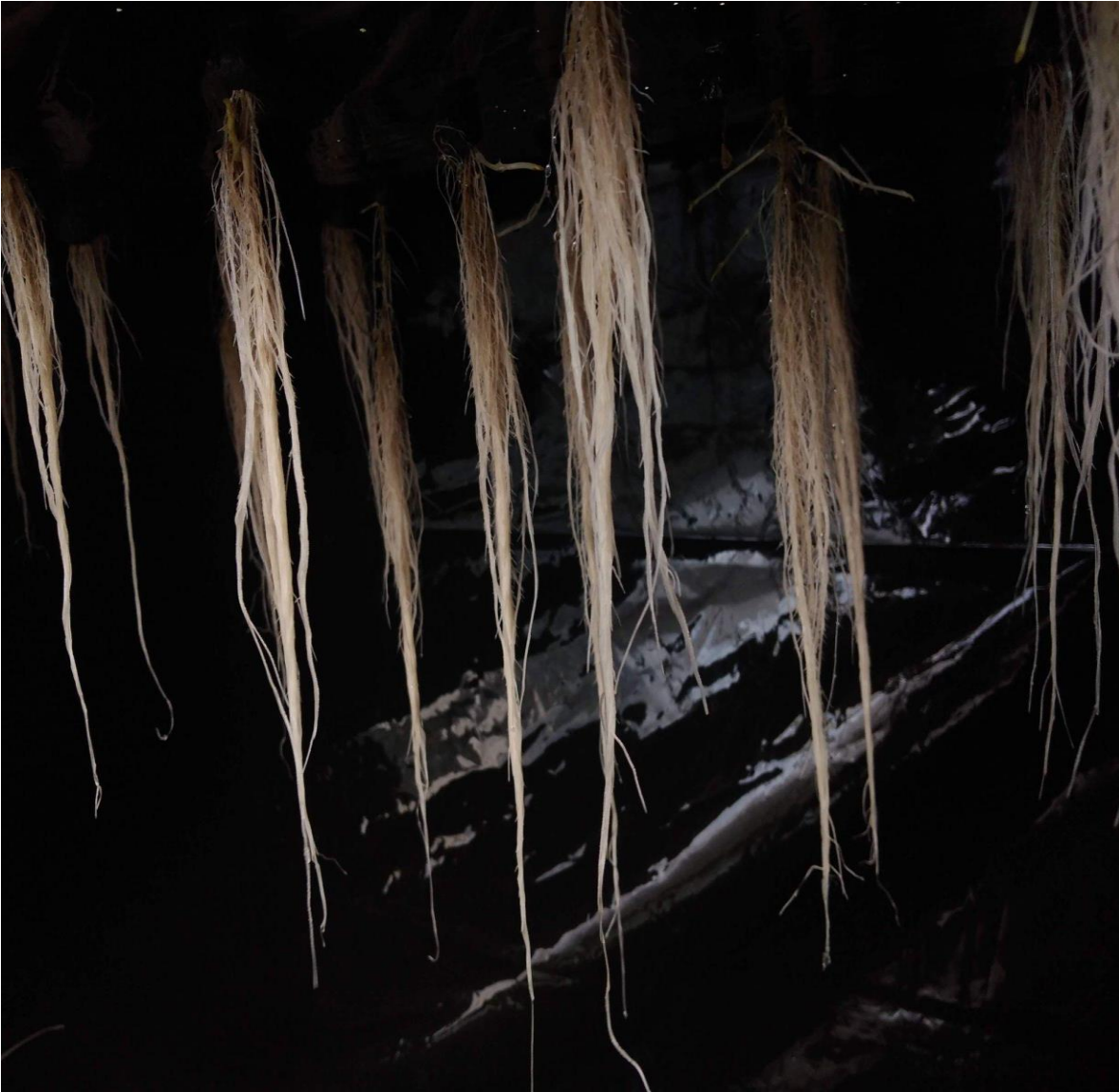
Figura 7. Etapa vegetativa en el cual tiene una C.E de 0.8 a 1.0 ds-m(Elaboración propia).