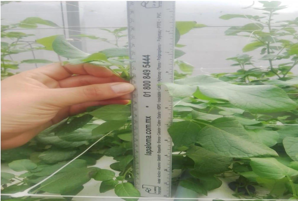
Figura 11. Medición de altura de tallo. (Elaboración propia).