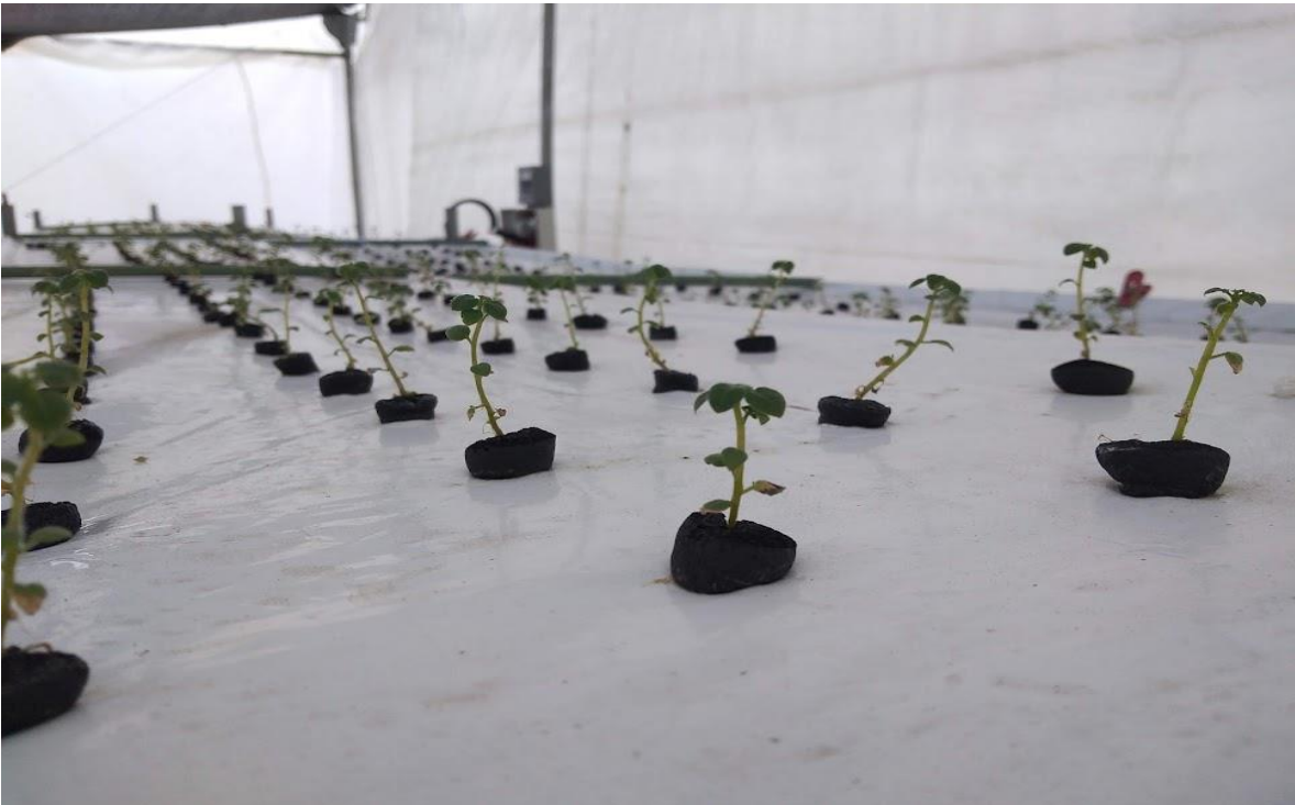
Figura 6. Transplante a módulo aeropónico. (Elaboración propia).