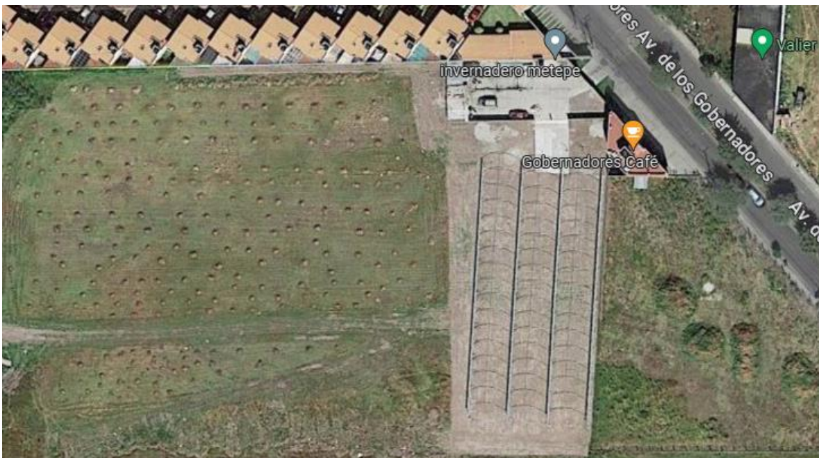
Figura 1. Ubicación de invernaderos (Elaboración propia).

El trabajo experimental se desarrolló dentro de las instalaciones de la empresa PRH AGROSERVICIOS S.A., de R.L. (Fig. 1), ubicada en Metepec, Estado de México, a 19^{\circ}16'10.8444'' N, y 99^{\circ} 36' 0.9432'' W. En esta zona se tienen temperaturas promedio de 20^{\circ}\text{C} durante el día y 16^{\circ}\text{C} durante la noche, con una humedad relativa del 60%. Contando con invernaderos y estructuras para sistema aeropónico como lo muestran las figuras 2 y 3