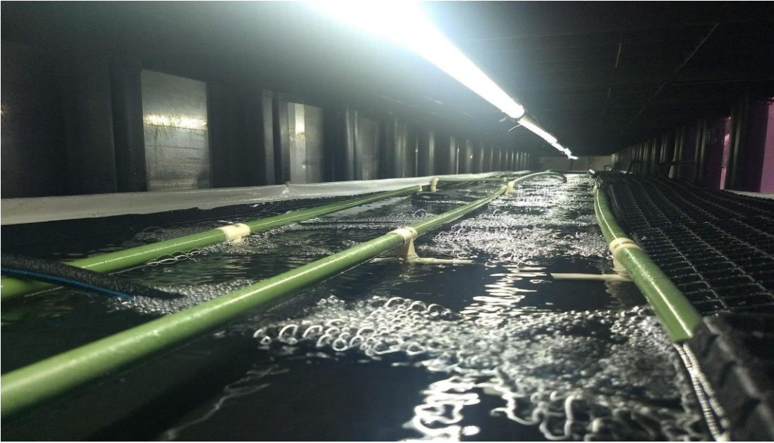
Figura 5. Sistema de burbujeo en cuarto de adaptación. (Elaboración propia).